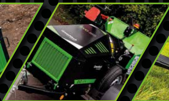
EVO 165 P