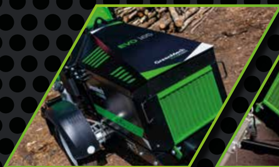
EVO 165 D