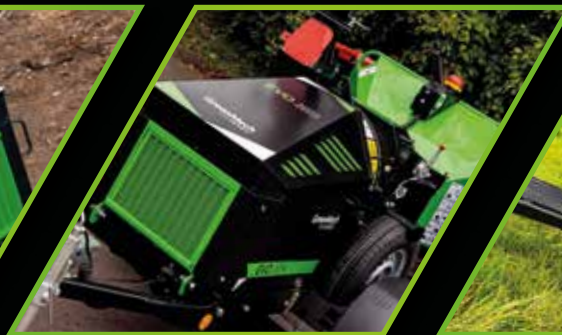
EVO 165 P