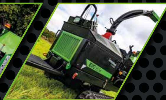
EVO 165 DT