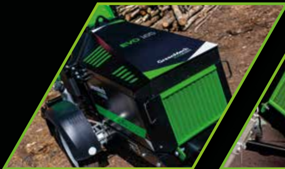
EVO 165 D